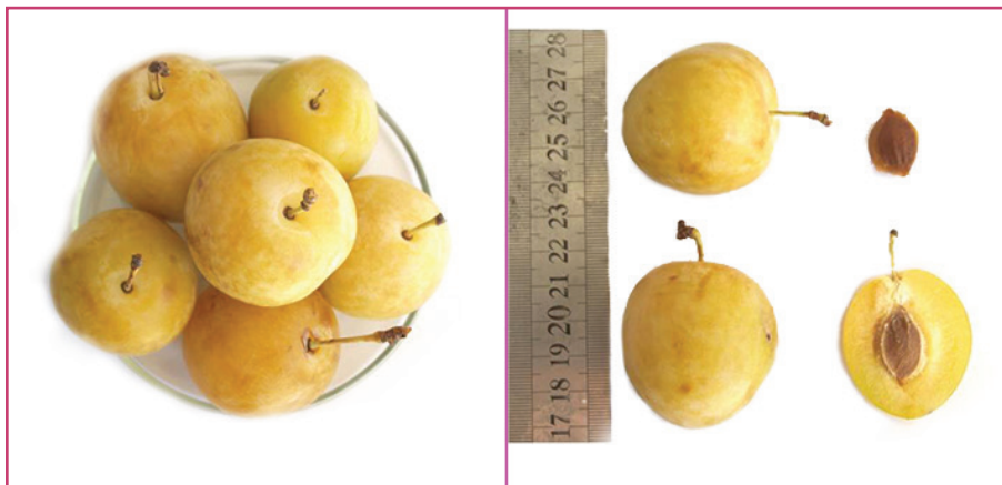
شکل ۲۰- رقم درگزی