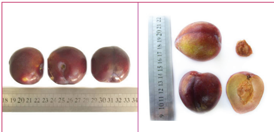
شکل ۴- رقم سیمکا