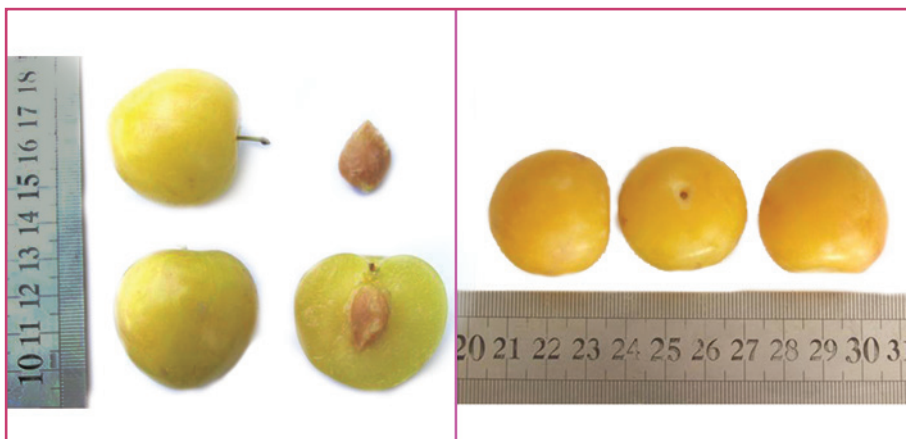
شکل ۱۷- رقم قطره طلا