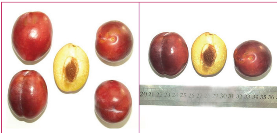
شکل ۷- رقم رجینا