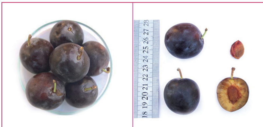
شکل ۱۸- رقم بخارا