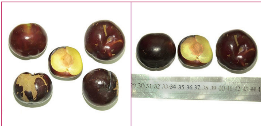
شکل ۱۵- رقم شماره ۱۷