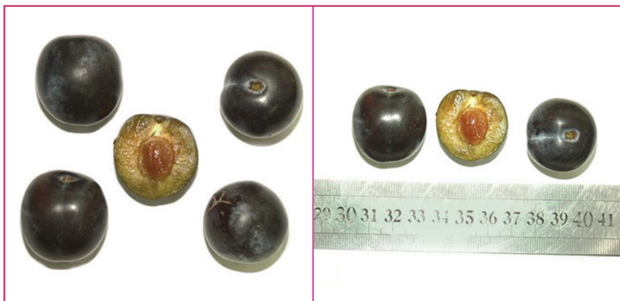
شکل ۱۴- رقم تی بلو