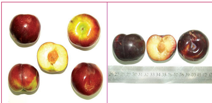
شکل ۱۰- رقم کویین رزا