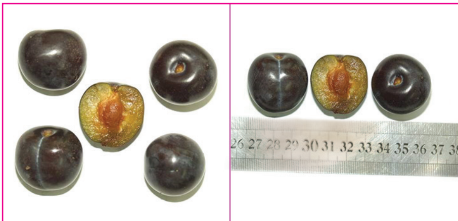
شکل ۵- رقم بلوفره