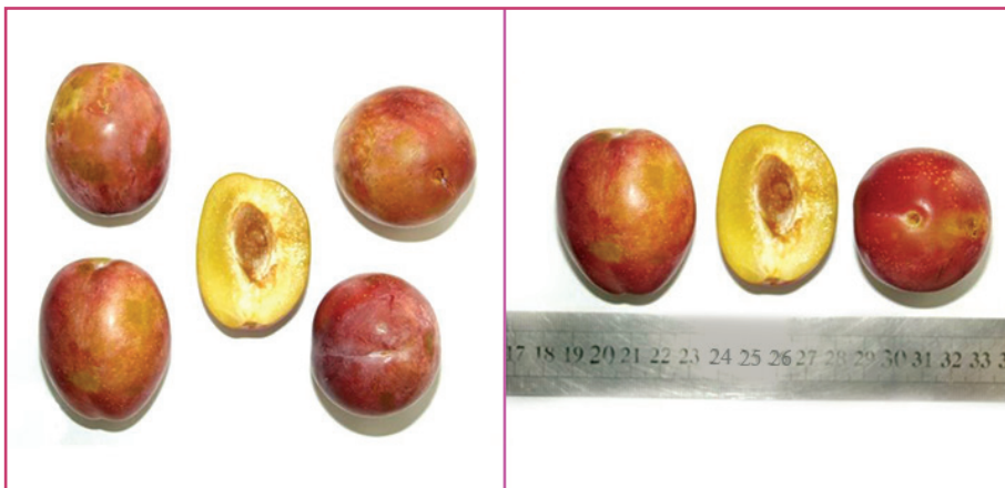
شکل ۱۱- رقم زوکلا