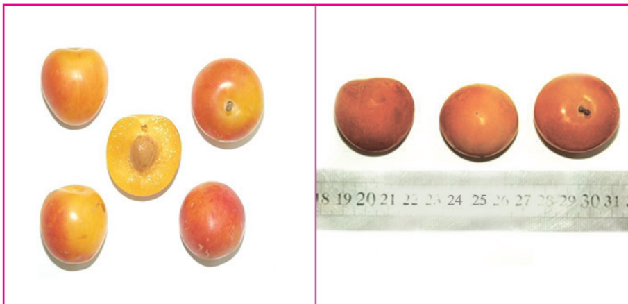
شکل ۱۳- رقم ارلی گلدن