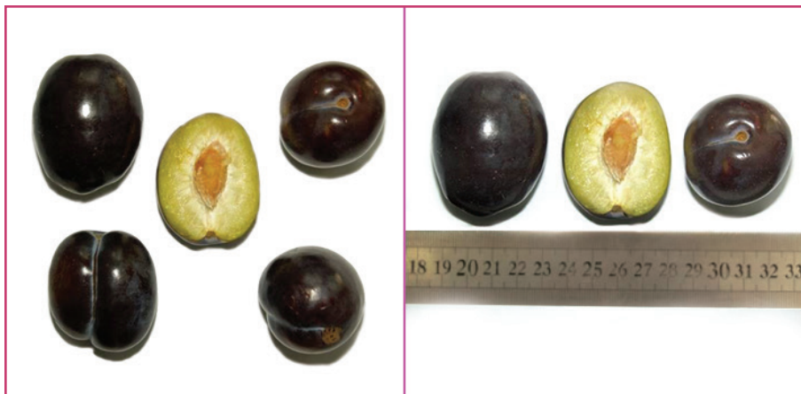
شکل ۲- رقم استانلی