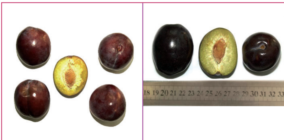
شکل ۳- رقم پرزیدنت