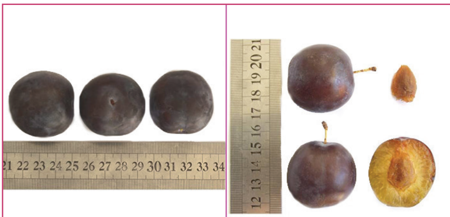
شکل ۱۹- رقم شمس