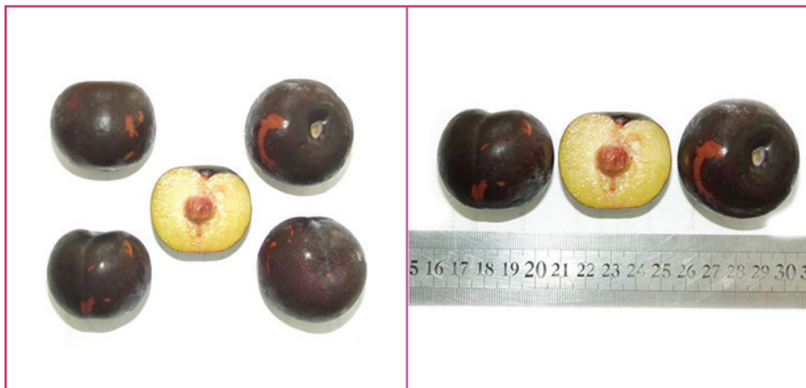
شکل ۶- رقم آنجلانو