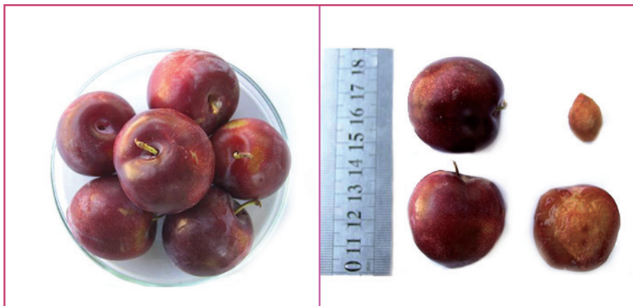
شکل ۱۶- رقم سانتارزا