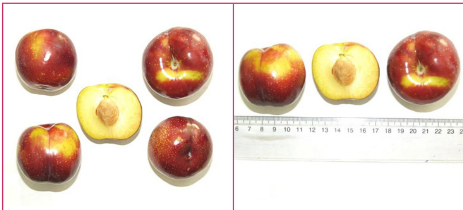
شکل ۱- رقم بلک دیاموند