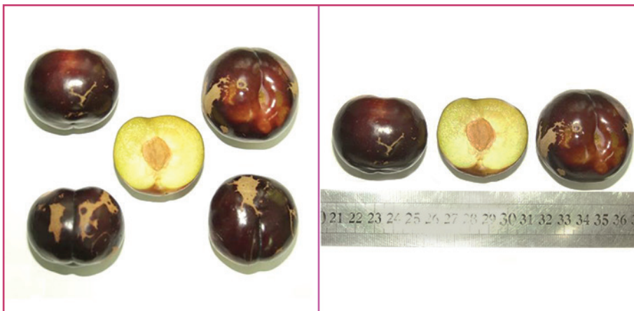
شکل ۹- رقم فرایر